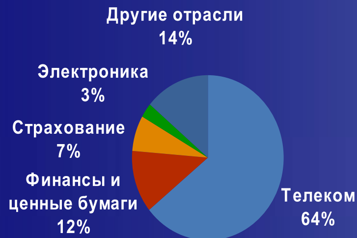
Суммарные активы (1)